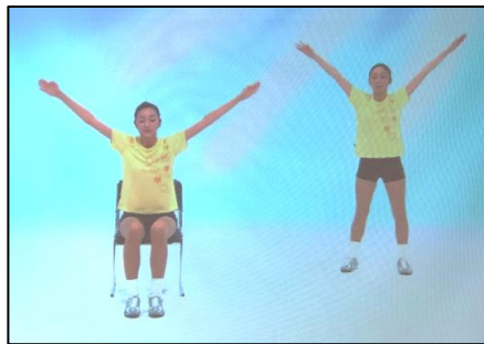
ラジオ体操スクリーン