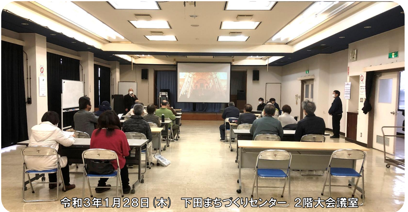
令和3年1月28日(木) 下田まちづくりセンター 2階大会議室