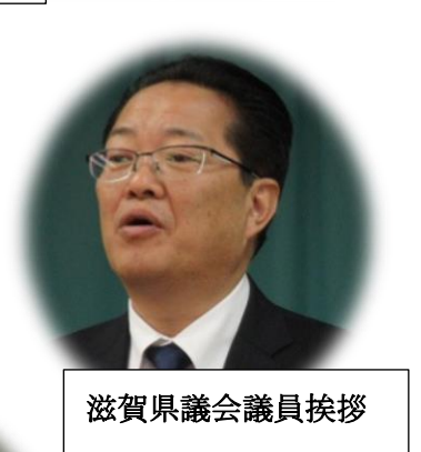
滋賀県議会議員挨拶