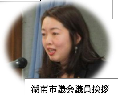
湖南市議会議員挨拶