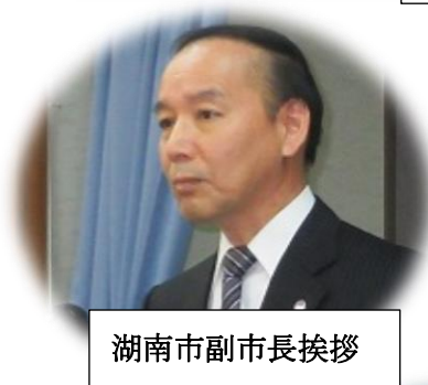
湖南市副市長挨拶