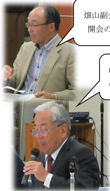
畑山副会長の 開会の言葉